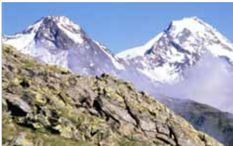
Naturschauspiel - Schwemmerspitze und Weißkugel

Ich kam in der angenehmen, morgenkühlen, sauberen Luft gut voran, auch den steileren Aufstieg durch den „Roßtauf“ hoch bis zum Taschenjöchli schaffte ich ohne Probleme. Ich fand keine einzige frische Spur auf dem Weg, das zeigte mir, dass heute früh noch niemand hier unterwegs war. Als ich in der Nähe am Joch war, zogen einzelne Wolken aus dem Tal über die Berghänge hoch, ich hielt inne, betrachtete und genoss das Naturschauspiel.