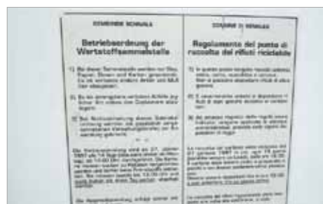
Betriebsordnung bitte einhalten!