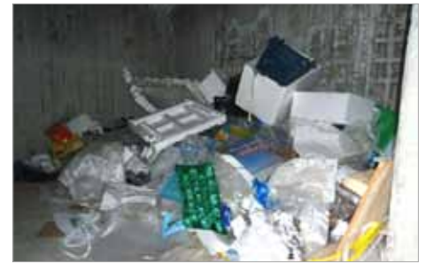
...kein schöner Anblick!

Die Gemeindeverwaltung sieht sich in Zukunft gezwungen, bei Nichteinhaltung dieser Verordnung, deren Übertreter ausfindig zu machen und die vorgesehenen Verwaltungsstrafen zu verhängen.