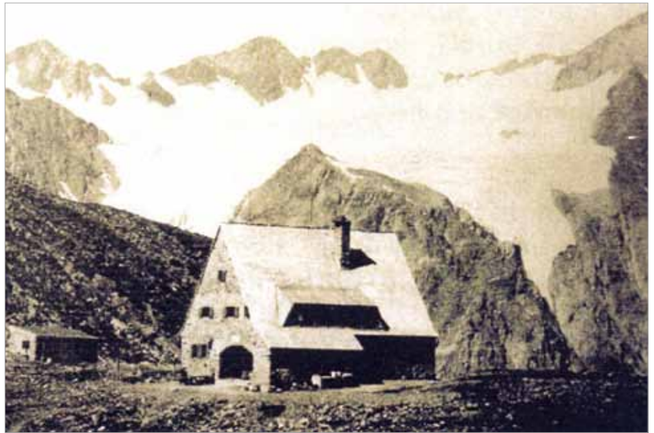
Die ehemalige Heilbronnerhütte

druck. Als Kind war ich Hirte auf der Lagaunalm und stieg öfters zum Jöchl hoch. Jedes Mal stand ich eine Weile still vor den Ruinen der ehemaligen Heilbronnerhütte. Meine Eltern hatten mir oft vom Schicksaal der Hütte erzählt. Meine Mutter hat im Kindesalter mit eigenen Augen gesehen, wie am Katharinsabend 24. November 1932 die Hütte in Flammen stand und sich der Himmel über das Taschenjöchl rot färbte. Das ganze Finail stand auf dem Balkon und blickte hilflos Richtung Heilbronnerhütte, sie konnten aber nichts tun. Diese Bilder haben meine Mutter bis heute nicht verlassen. Klar war, ab nun gab es auch für die letzten Pächter, die Wieserleut, kein Wieder-