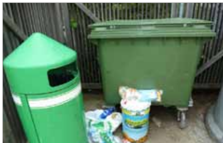
...kein Restmüll in den Wertstoffinseln!

Durch den geregelten Müllabfuhrdienst, durch die gezielte Mülltrennung, durch die Bereitstellung der grünen Tonne, der Container (bei Wert-