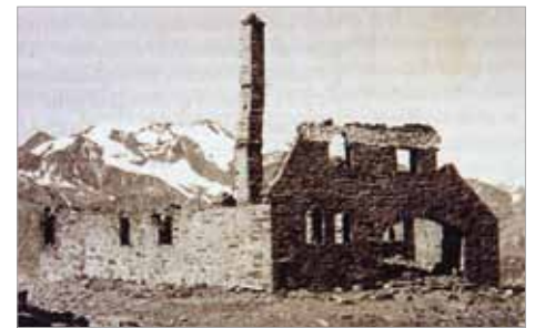
Brandruine Heilbronnerhütte 1932

Beendet habe ich meine Gedanken mit einem kurzen Auszug aus Reinhold Stechers „Die Botschaft der Ber-