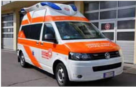
Das neue Einsatzfahrzeug VW T5

Der Landesrettungsverein Weißes Kreuz - Sektion Naturns wird am 07. November 2010 in der Gemeinde Partschins einen neuen Krankentransportwagen offiziell der Bestimmung übergeben. Dank eines großzügigen