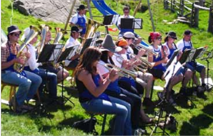
St. Kathrein Böhmische