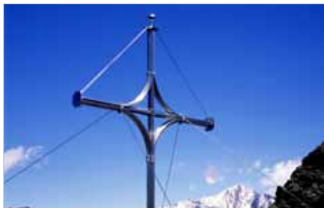
Elegant und ansprechend in seiner Form

Damals, im fernen Jahr 1910 , am 9. August, um 12 mittags standen ca. 120 Gäste vor der mit Tannengewinde und Alpenblumen geschmückten Hütte um der Einweihungsfeier beizuwohnen, mit Musik, Gesang und Böllerknall. Heute nun, 100 Jahre später, auch Festreden, dann die Bergmesse – mit Blick zu den Dolomiten im Osten, zur Cevedale und Ortlergruppe im