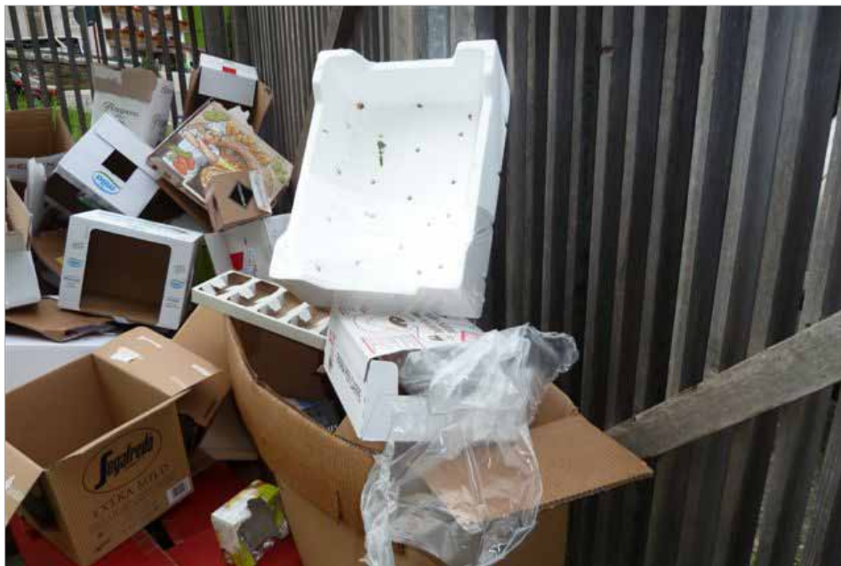
...so bitte nicht

Unser Tal ist geprägt von eine wunderschönen Natur- und Kulturlandschaft. Deshalb ist es schade, wenn wir Menschen durch falsches Verhalten diese Schönheit „verschandeln“. Wir alle, private Haushalte, Gastbetriebe, Handelsbetriebe, Handwerker und Touristen verursachen Müll.