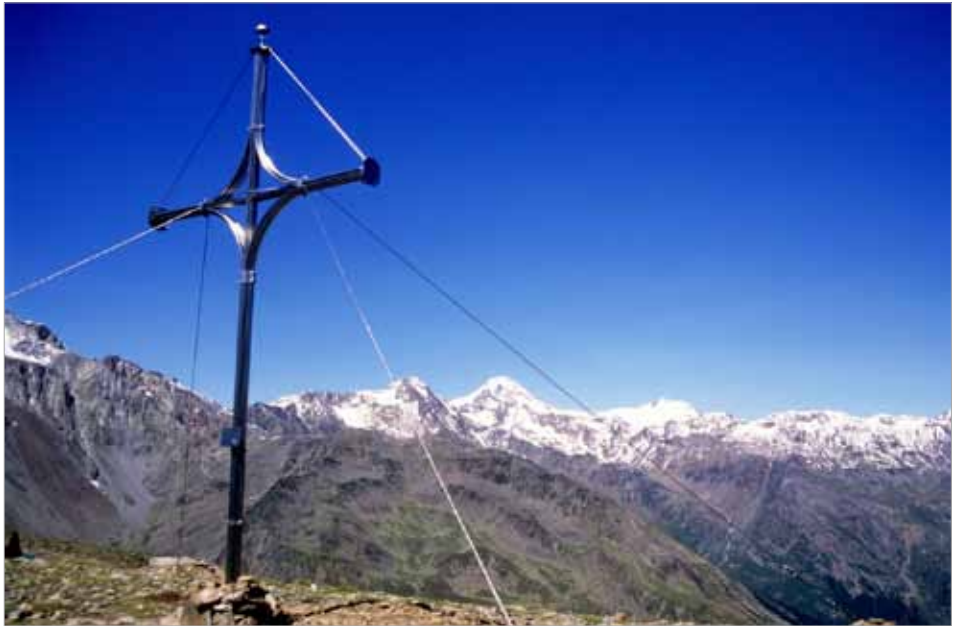
Das neue Gedenkkreuz auf dem Taschenjöchli 2770m

Drei Bergwanderer traf ich oben am „Taschenjöchli“, sie waren von der anderen Seite, aus dem „Schlenderauntal“ hochgekommen. Da es noch länger dauern würde bis zur Weihe des neu aufgestellten Gedenkkreuzes, entschloss ich den Grat ent-