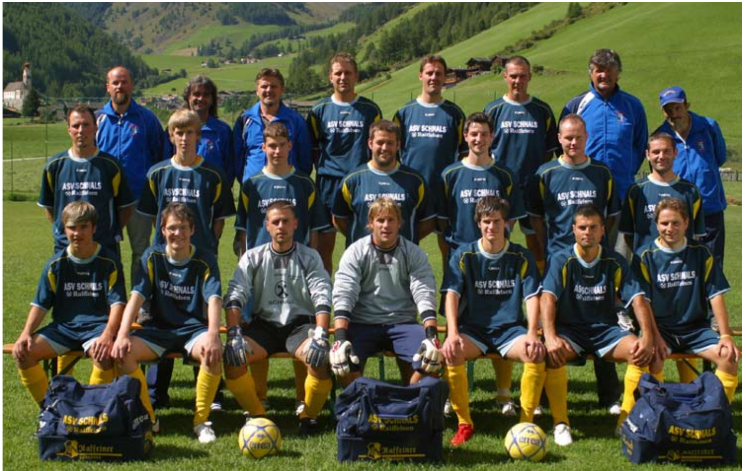
Die Aufsteigermannschaft des ASV Schnals 2009