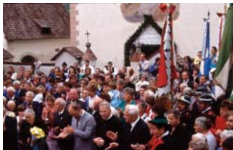
Feier auf dem Kirchplatz 1989

Vor 20 Jahren fand auf dem Kirchplatz in Unser Frau ein schönes Fest statt. Bereits am Samstagabend, den 5. August 1989 wurde die Vorfier gehalten. Ein großartiges Bergfeuer mit der Zahl 50 kündigte das Fest an. Am Sonntag, den 6. August 1989 feierte dann die ganze Pfarrgemeinde das 50 jährige Priesterjubiläum des Seelsorgers Rudolf Gamper.