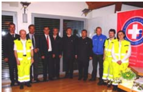
Sektionsleitung Weißes Kreuz Naturns mit Ehrengästen

Wie wertvoll und einsatzreich das Jahr 2008 für die Sektion Naturns war, konnten die Ausschussmitglieder durch den umfangreichen Tätigkeitsbericht vermitteln.