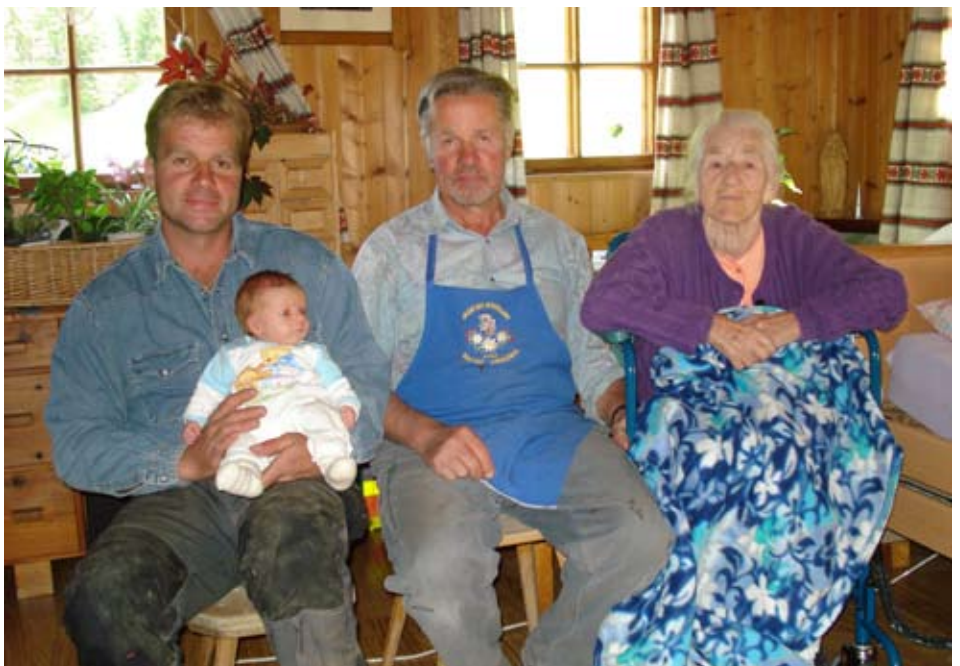
Vier Generationen nebeneinander,