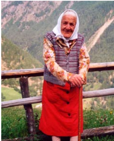
Fina am Sennhof