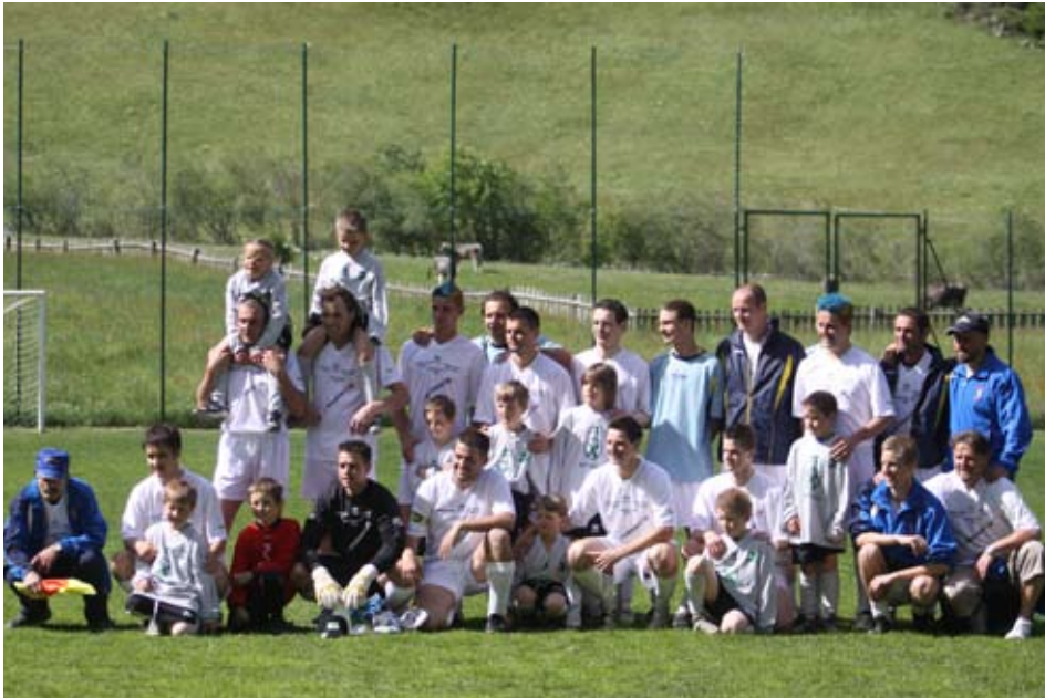
Die „Aufsteiger-Mannschaft“ in die 2. Amateurliga

Nach zweijähriger Abwesenheit kehrt der ASV. Schnals in die 2. Amateurliga zurück !