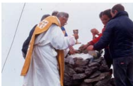
Bergmesse Lagaunspitze 20.09.1981