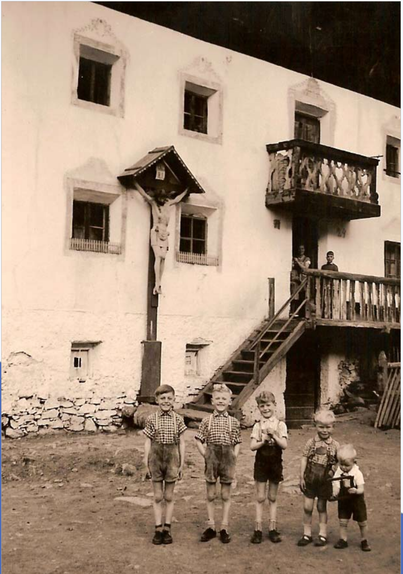
„Moarbuabm im Feirtagwond“ Katharinaberg