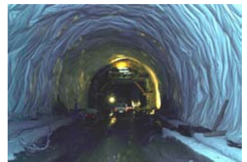
Tunnelarbeiten am Taleingang

Durch den Bau von zwei Tunneln entlang der ersten drei Kilometer der Schnalserstraße im Jahre 2001 konnte