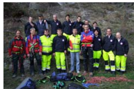
WK Naturns und BRD Schnals

In Zusammenarbeit mit dem BRD im A.V.S. Schnals konnte heuer eine Interne Fortbildung zum Thema „Mehr Sicherheit im Einsatz in unwegsamem Gelände“ angeboten werden. Beim ersten Teil dieser Fortbildung wurde allen klar, dass nicht nur gute Ausrüstung sondern auch theoretisches Wissen und vor allem praktische Erfahrung für einen erfolgreichen Rettungseinsatz im unwegsamem Gelände äußerst wichtig sind. Schon der vom Technischen Leiter des BRD Schnals, Neno Ongaro, am 10. September vor