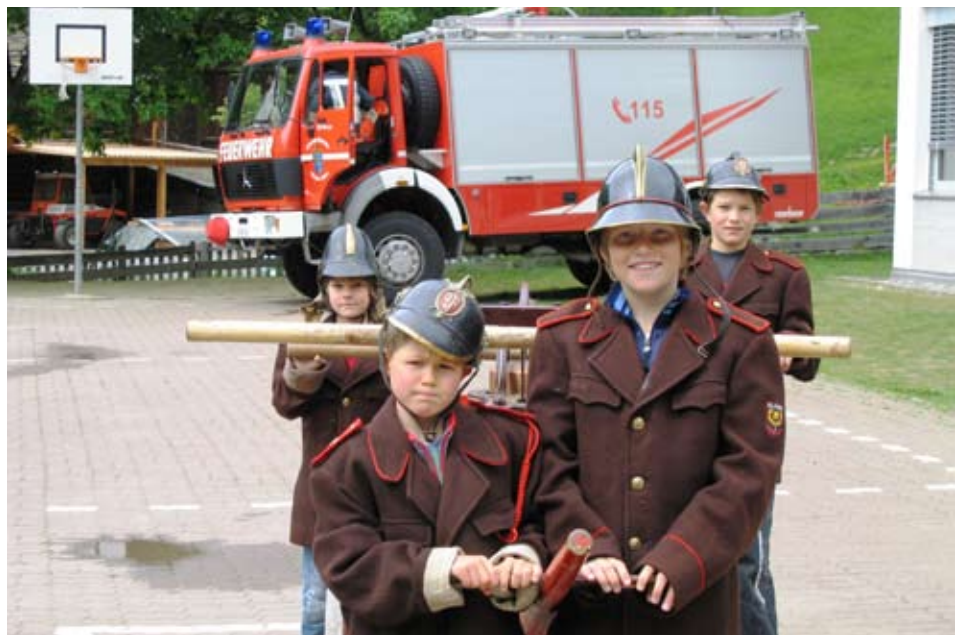
„Schnuppern“ bei der Feuerwehr

So ist es sicher auch vielen Buben und Mädchen ergangen. Dann, nach der Pflichtschulzeit, ist es auch mir so passiert, dass alles andere wichtiger war. Doch dann kam die Zeit, wo einige Kollegen beschlossen haben „wir gehen zur freiwilligen Feuerwehr“. Alleine wäre das sicherlich nicht so interessant gewesen. Dass wir eine Woche lang einen Grundkurs absolvieren mussten,