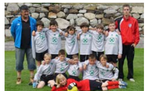
Das Jugendteam „U 11“