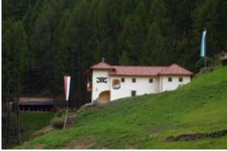
Der neu sanierte Schießstand

Umgebaut, saniert, modernisiert (Teil 2)