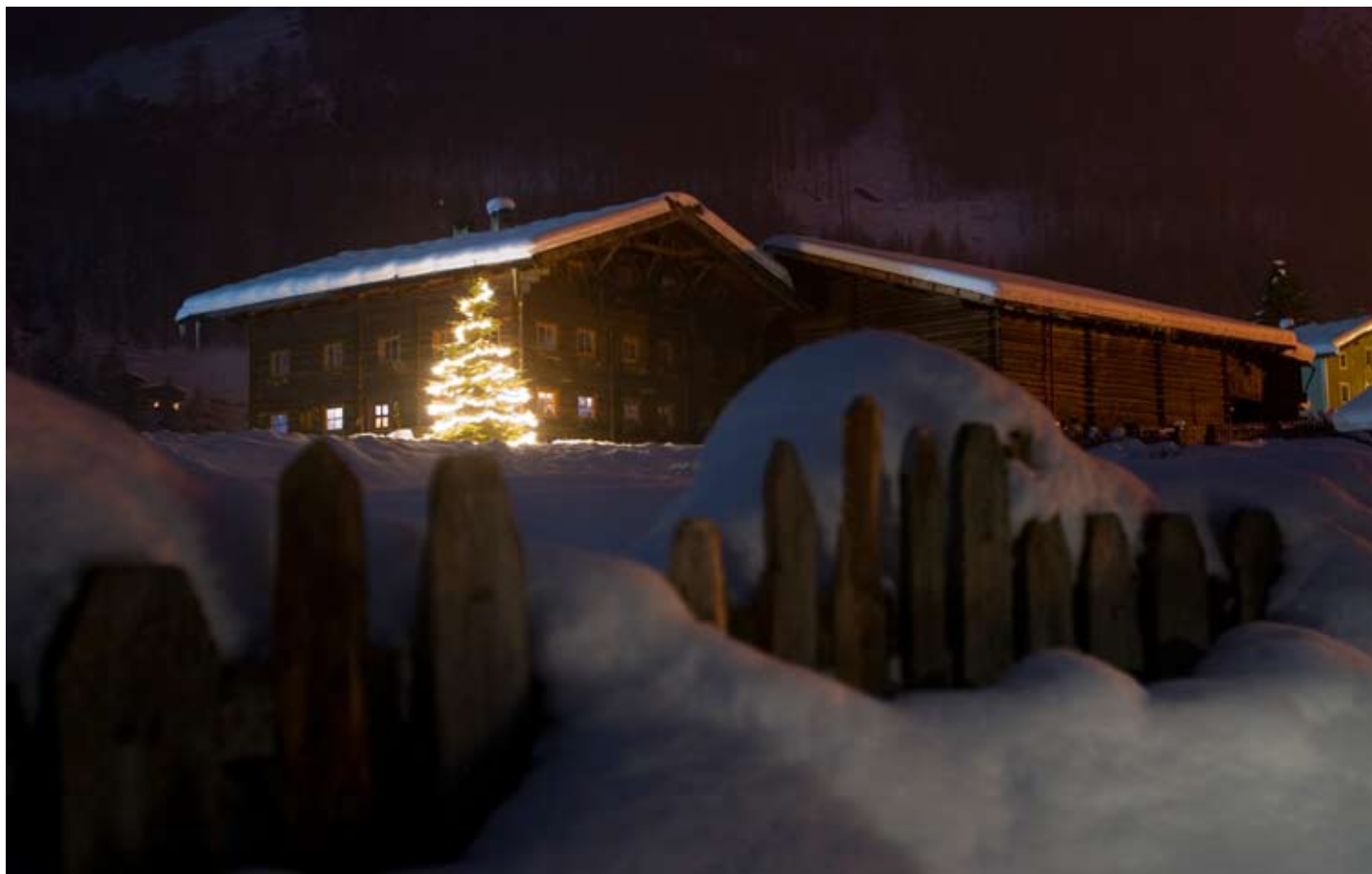
Unterauhof in Unser Frau

O Weihnachtszeit, o Weihnachtszeit, - Du hast die schönsten Bäume! Manch Blümlein blüht im Gartenraum, - Doch keines glänzt wie der Weihnachtsbaum. (Kritzinger)