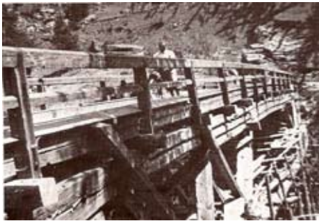
Die „Hohe Brücke“ aus Holz