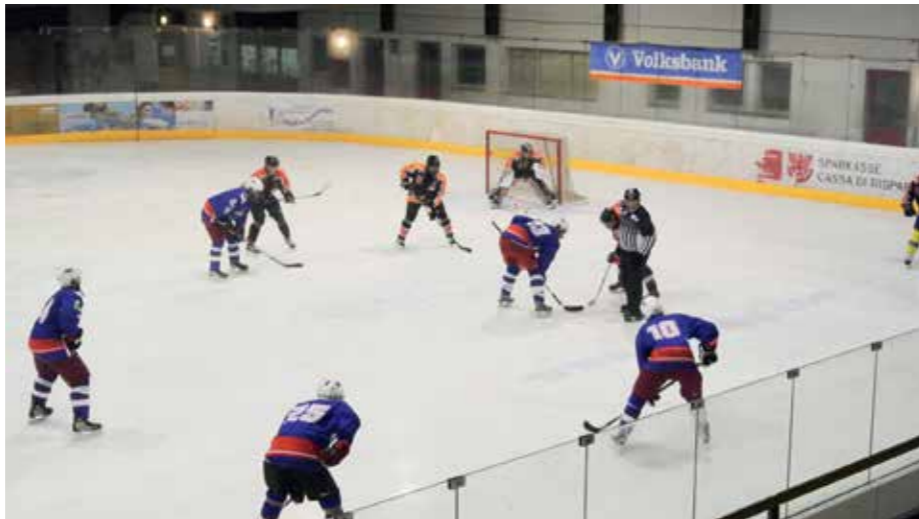
Szene vom Spiel gegen den AHC.