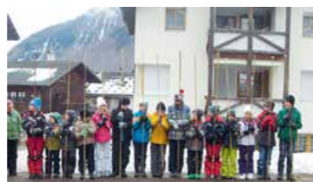
Grundschüler Unser Frau

Dann haben sie uns gezeigt, wie man einen Verletzten mit der Trage im Berg abtransportiert. Sie legten ein Kind in