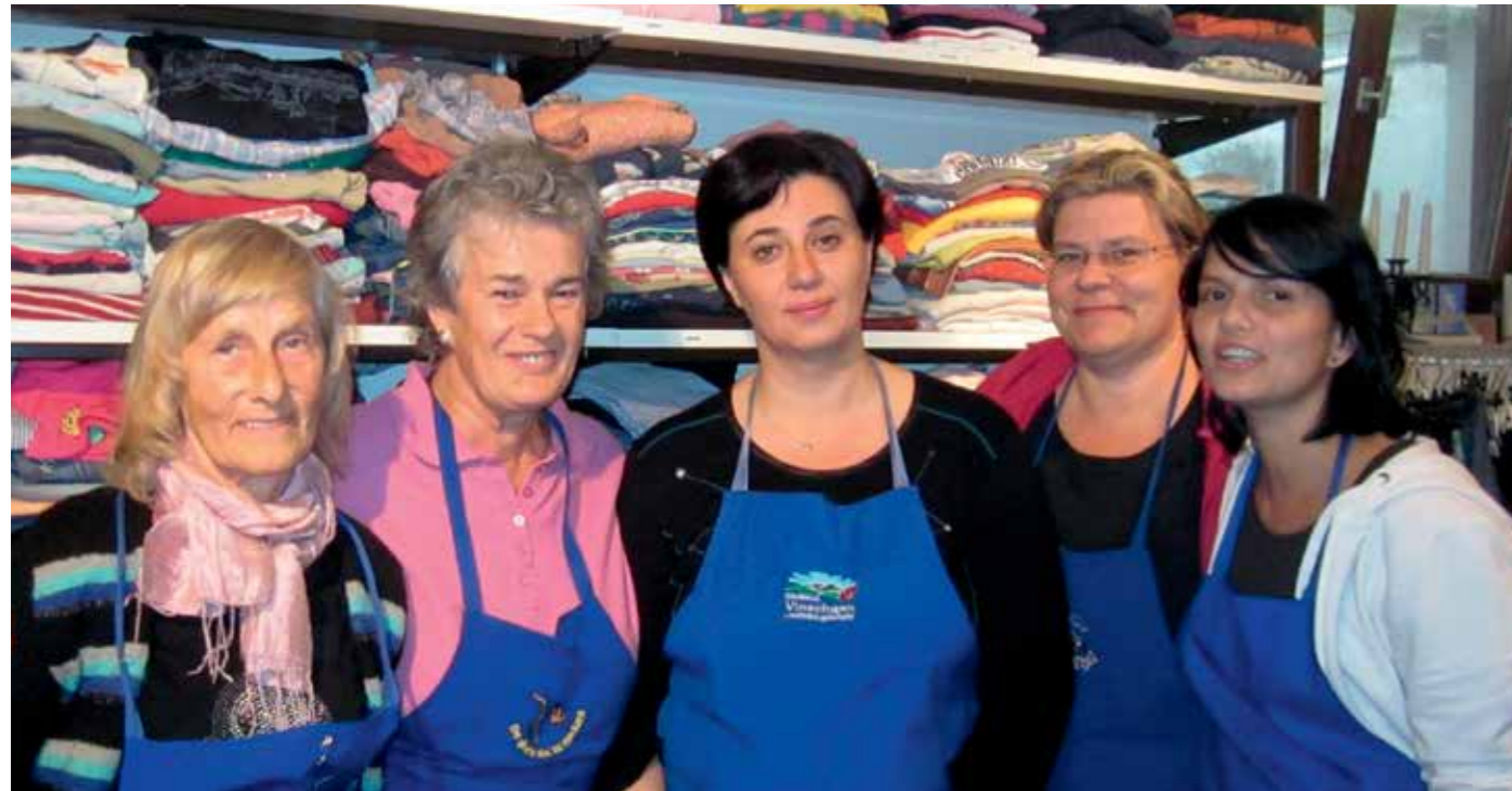
Freiwillige der Kleiderstube „Wilma“ in Rabland