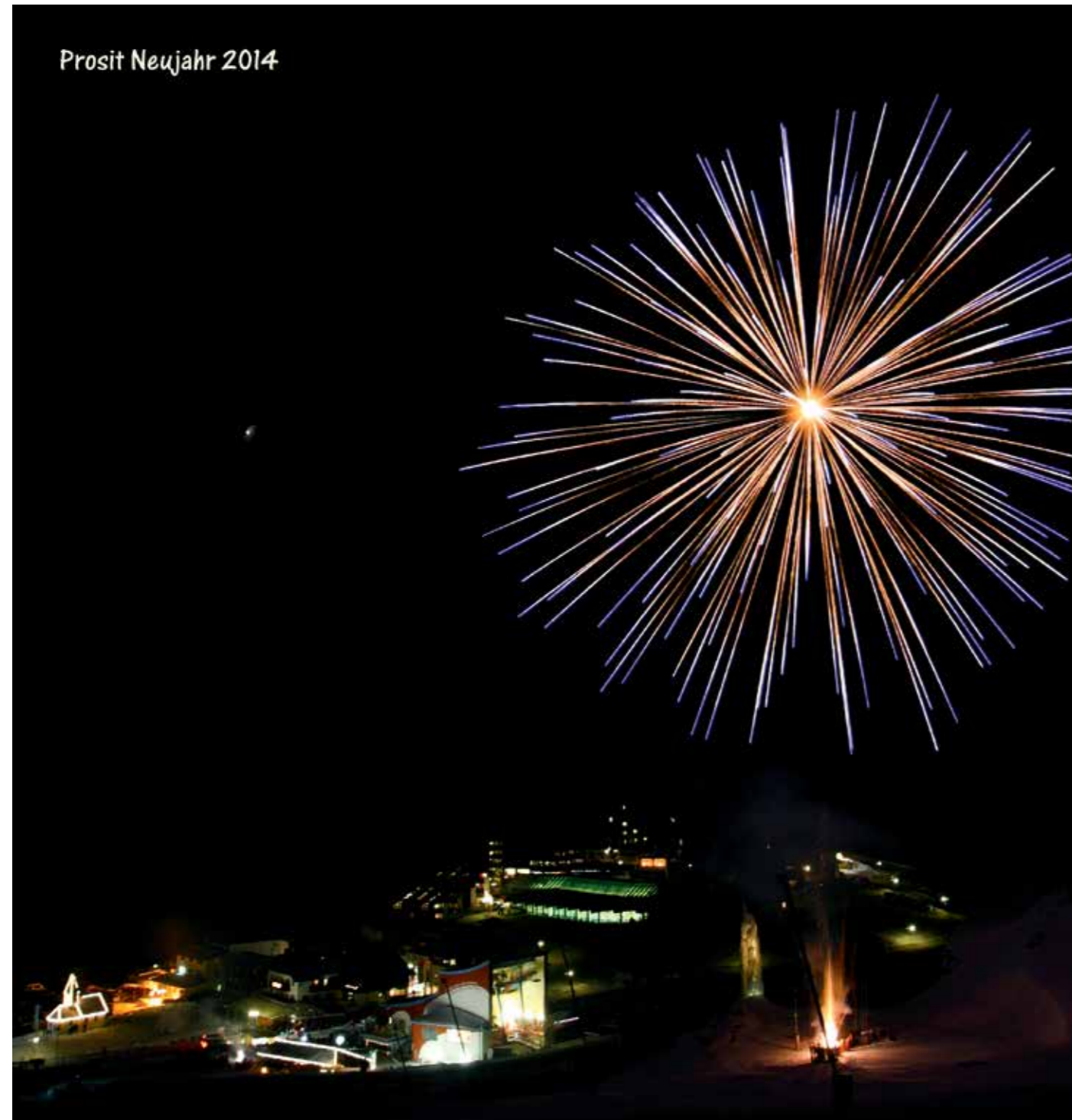
Silvester in Kurzras

4 - 7 Aus der Gemeindestube Wichtige Beschlüsse Erlassene Baukonzessionen Schneeräumungsdienst Verstorbene des Jahres 2013