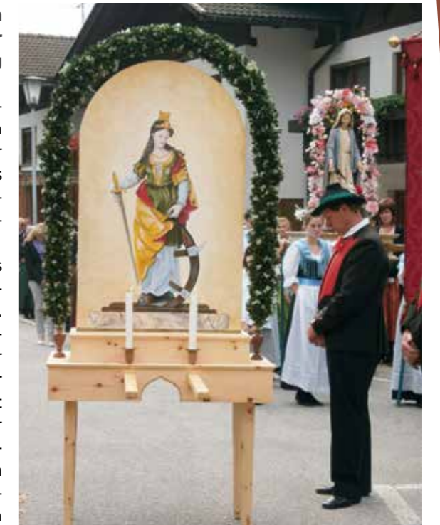
Bildnis der Hl. Katharina

wie auf einer Fotografie zur Geltung. Den Tragetisch mit dem Sockel fertigte Andreas Kneissl in liebevoller Kleinarbeit und mit handwerklichem Geschick an. Er ließ es sich auch nicht nehmen, die Kerzenständer selbst zu drech-