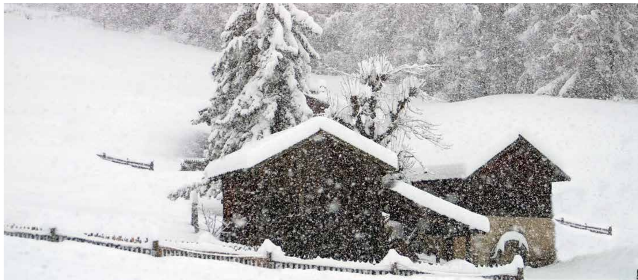
Ensemble beim Oberpirfallhof