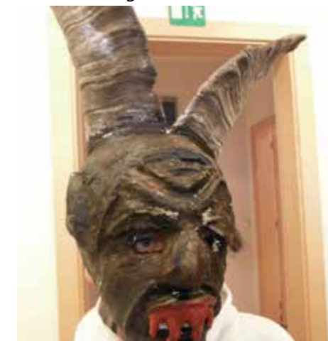
Fertig gebastelte Krampusmaske