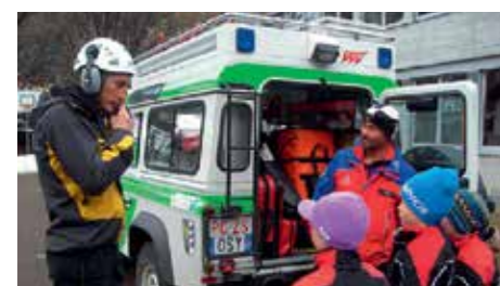
Grundschüler Unser Frau