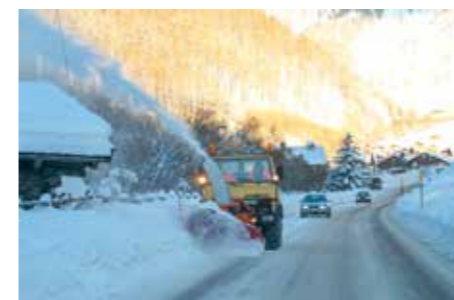
Strassendienst Schnals im Einsatz

In einer Aussprache mit dem Maschinenring und den Fahrern wurden die wichtigsten gesetzlichen Bestimmungen durchgesprochen, aber auch über den Räumungsdienst selbst wurde Rückschau und Vorschau gehalten. Das zu räumende Straßennetz in Schnals ist viele Kilometer lang. Der Schneepflug kann aber nicht überall gleichzeitig sein. Deshalb muss die Gemeindeverwaltung Prioritäten setzen. Vorrang haben natürlich immer Notfälle, dann die Hauptzufahrtsstraßen zu den Dörfern (SAD Parkplatz, Feuerwehrhallen, Schulgebäude.....), die Zufahrtsstraßen in die Wohnbauzonen, dann die Zufahrten zu den einzelnen Höfen und Häusern.