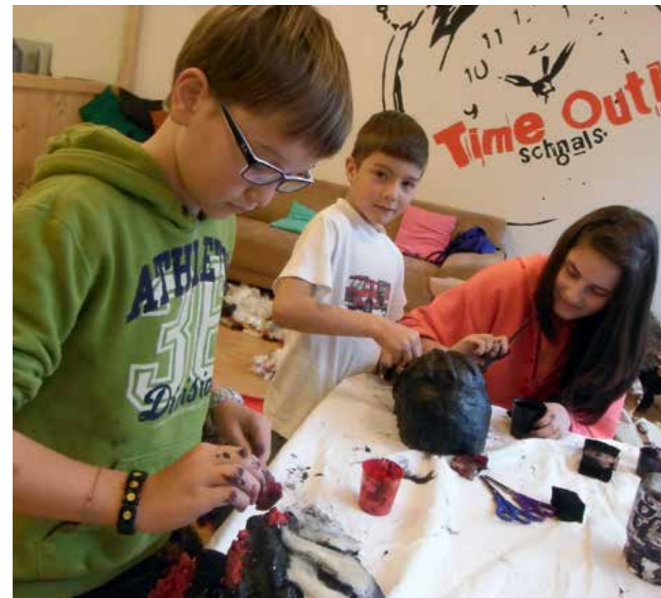
Masken werden geformt, bemalt und geklebt

und klebten, malten, schraubten und formten bis die Masken perfekt waren. Neben der richtigen „Lorv“, durfte das „Krampusgwind“ natürlich nicht fehlen. Nach mehr als 25h Arbeit konnten sich die neuen Krampusse beim Krampusumzug zeigen lassen: Von groß bis klein waren alle aufgeregt. Am 5. Dezember war es schließlich soweit - Vom Dorfplatz in Unser Frau startete man mit Getöse und Gebrüll. Nachdem das gesamte Dorf von den kleinen und großen Krampusen unsicher gemacht wurde, kam man schließlich wieder zum Dorfplatz zurück. Dort gab es warme Getränke, gute Unterhaltung und etwas zum Knabbern. So endete das erste große Projekt des Jugendtreffs „Time Out“ in Zusammenarbeit mit dem Leitbild und dem Katholischen Familienver-