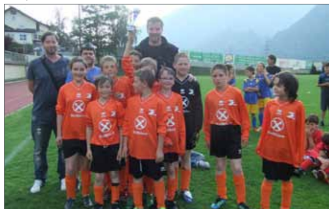
Die U-10 Mannschaft

Wichtig bei den Kindern in diesem Alter ist aber vor allem der Spass am Spiel, und dies zeigten die jungen Kicker eindrucksvoll.