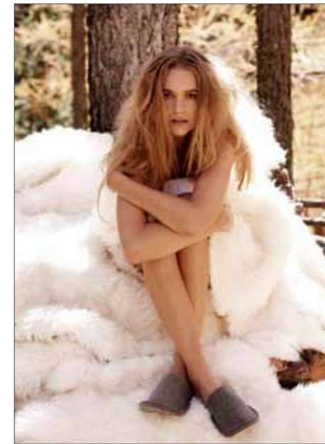
Fotoshooting für den ipotsch im Lärchenwald beim Vernagt See.