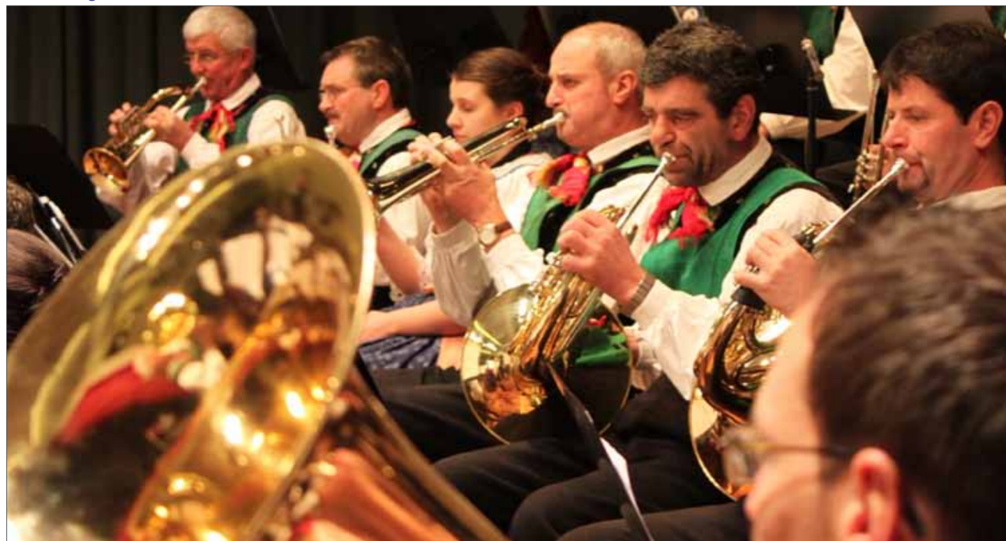
Blick in die Reihen der Musikkapelle Unser Frau-Karthaus

Nach dem erfolgreichen und arbeitsintensiven Jubiläumsjahr startete die Musikkapelle Unser Frau-Karthaus gleich voll in das neue Jahr 2012 durch. Sie begeisterte die zahlreichen Besucher mit einem beeindruckenden Winterkonzert. Das intensive Proben der letzten Monate hat sich gelohnt, denn die mittlerweile 51 Musiker auf der Bühne meisterten ein anspruchsvolles Programm mit Stücken aus dem 16. Jahrhundert bis hin zu zeitgenös-