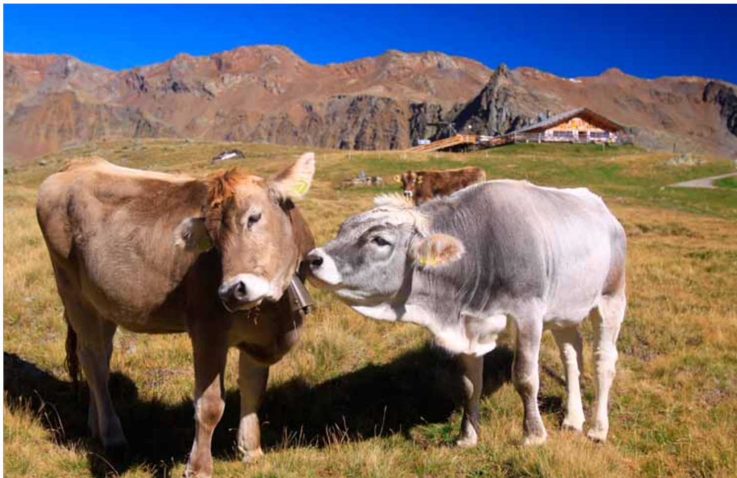
Lazaun Alm