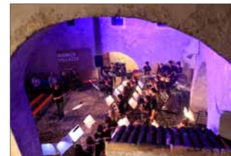
Jugendkapelle Schnals und Latsch

de Blasorchester auf der Bühne Platz und sorgten mit zwei Zugaben für lange anhaltenden Applaus. Im bis auf den letzten Platz gefüllten Schlosshof strahlten Jungmusikanten und Eltern vor Begeisterung um die Wette! Am 09. Juni wurden einige der einstudierten Stücke beim Abschlusskonzert der Musikschule im Haus der Gemeinschaft in Unser Frau zum Besten gegeben und sorgten auch hier für einen krönenden Abschluss. Einige begeisterte Jungmusikanten werden im Sommer, bei einer der vom Verband Südtiroler Musikkapellen angebotenen Jungbläserwochen teilnehmen. Ein tolles Angebot, um sich musikalisch weiterzubilden. Vor allem aber, um neue Kontakte und Freundschaften zu knüpfen, wobei Musik, Sport und Spaß hervorragend miteinander verbunden werden können.