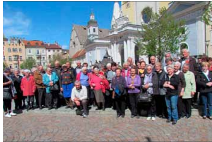
Frühlingsfahrt 2012 nach Brixen