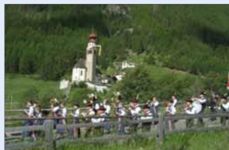
Prozession Herz Jesu