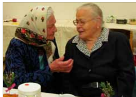
„A gemiatlich's Ratscherle“