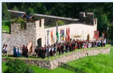
Prozession Annatag 2011