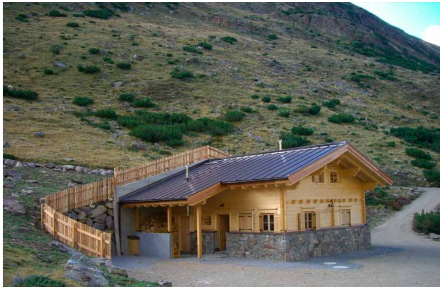
Almhütte Niedertal (Ötztal)

Vom Dorf Vent aus geht man eine „gute Stunde“ bis zur Almhütte!