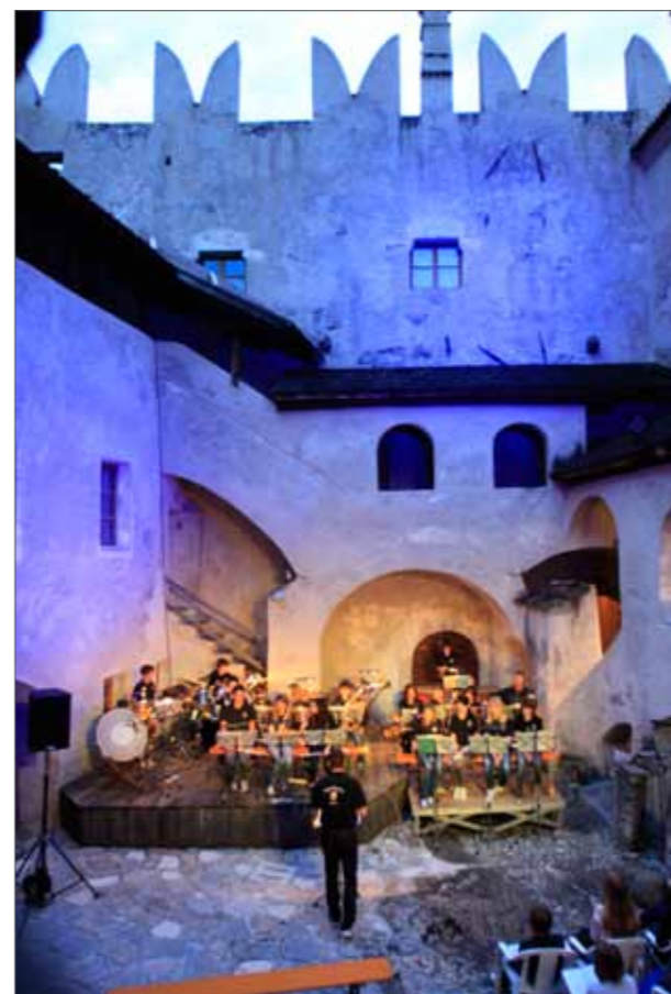
Konzert der Jugendkapelle im Schloss Kastelbell

Auf ein aktives Schuljahr 2011/12 können die Schüler und Lehrer der Musikschule Schnals zurückblicken. Neben Auftritten bei kirchlichen und weltlichen Feiern, hatten fast alle Musikschüler die Möglichkeit beim internen Vorspiel der Musikschule als Solist oder in der Gruppe vor Publikum zu spielen.