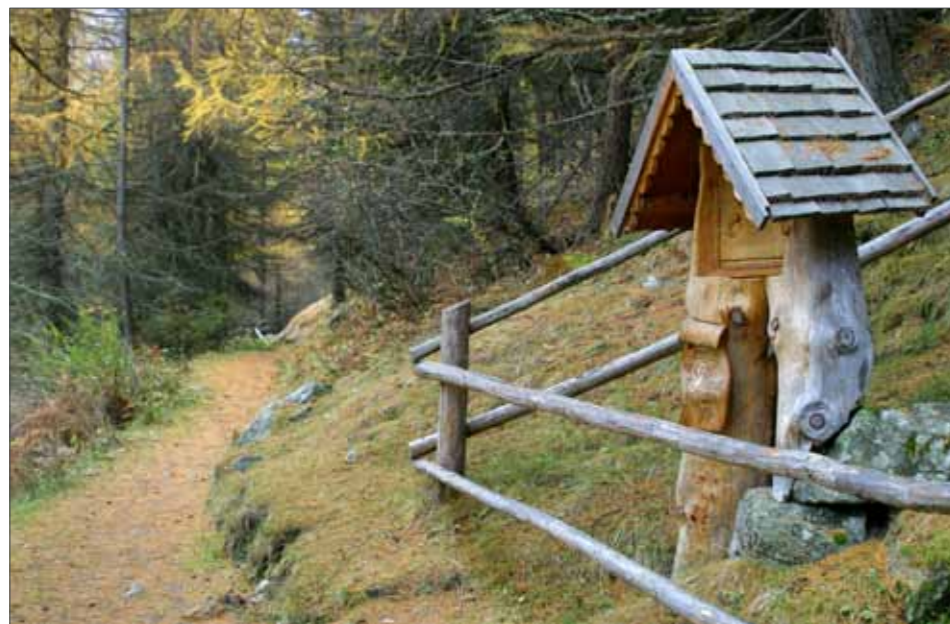
Wallfahrtsweg in Unser Frau

Am Samstag, den 9. Juni 2012 fand der zweite Aktionstag „Unsere Wanderwege“ statt. Vierzehn „Freiwillige“ haben sich heuer daran beteiligt.