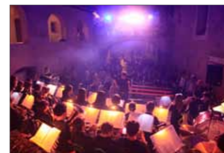
Jugendkapelle Schnals und Latsch

den von besonderen Lichteffekten unterstützt. Zum Schluss nahmen bei-