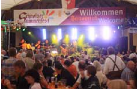
Stimmung im Festzelt

Bereits zum fünften Mal findet am 9. und 10. Juli das Schnolser Summerfest statt. Eine großartige Musikveranstaltung, die mittlerweile über die Grenzen Südtirols hinaus bekannt ist. Auch in diesem Jahr werden wieder zahlreiche namhafte Musikgruppen und -interpreten aus Südtirol, Österreich, Deutschland und Slowenien für ein musikalisches Feuerwerk sorgen.