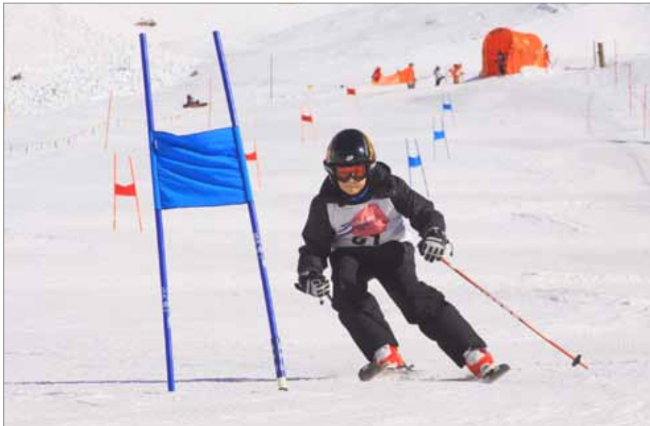
Abschlussrennen Kinderskikurs auf der Glockenpiste in Kurzras

Jede Mannschaft bestand aus 3 Läufern wo jeder 3 Durchgänge absolvierte