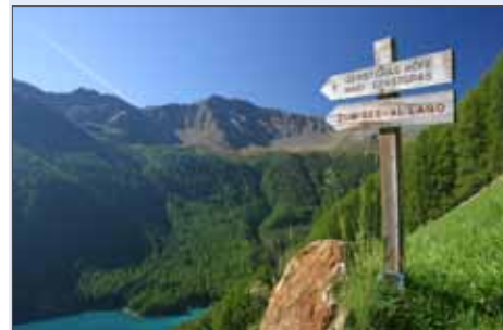
Beschilderung unserer Wege

Am Samstag, den 28. Mai 2011 fand zum ersten Mal ein Aktionstag „Unsere Wanderwege“, statt. Zusammen mit den Partnern Tourismusverein Schnals, dem Hotelier- und Gastwirteverband, dem Alpenverein Ortsstelle Schnals und der Bauernjugend wurde dieser Tag organisiert. Über zwanzig Freiwillige meldeten sich und begaben sich mit Pickel und Schaufel auf den