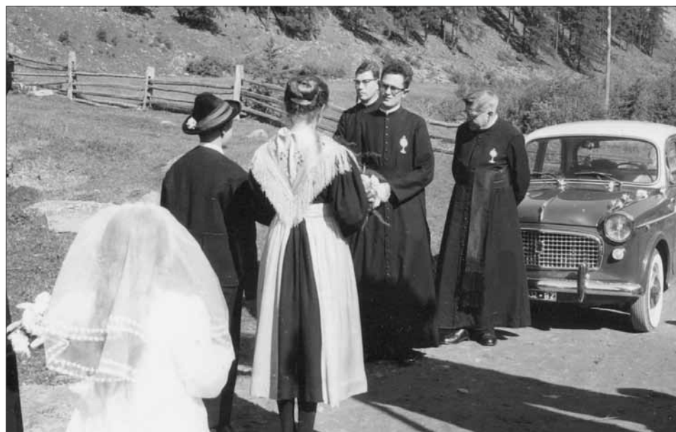
Empfang im „Hößgang“ mit Gedichten

ten Jahrhundert mit Seltenheitswert. Theologiestudenten und Jungpriester auf Finail