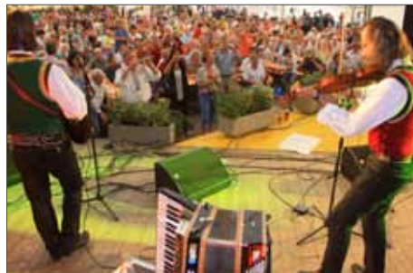
Schnurrbart, Hut und Geige ...