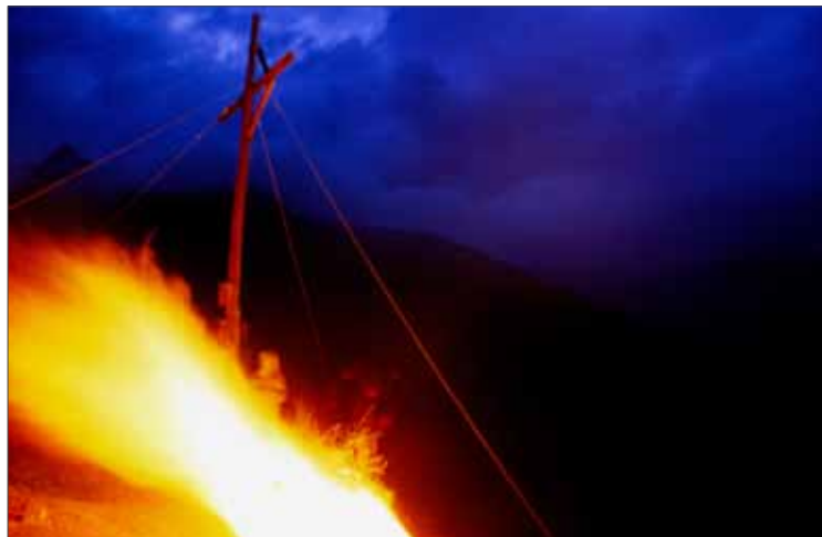
Herz Jesu „fuirn“ über 200 Jahre alter Tiroler Brauch

Die Tiroler haben den Bund mit dem heiligen Herzen Jesus 1796 geschlossen. Seitdem wird in ganz Tirol das „Herz Jesu Fest“ gefeiert, mit festlichen Gottesdiensten und Prozessionen und dem Gelöbnis zum heiligsten Herzen Jesu. Auf den Bergen werden am Abend „Herz Jesu Feuer“ abgebrannt. So war es auch am 11. Juni 1961: zuerst eins, dann zwei, nach und nach brannten immer mehr