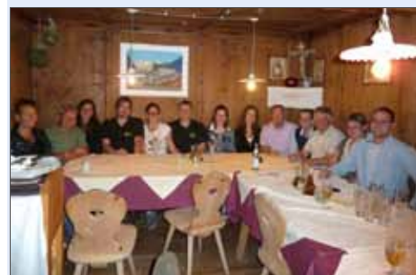
Erfreulicher Rückblick am Abend

Wegen. Die Instandhaltung unseres Kilometer langen Wegenetzes ist eine große Herausforderung. Wir haben gezeigt, gemeinsam kann vieles bewegt werden. Bei einer Pizza am Abend wurde Rückblick gehalten. Der Tag war ein Erfolg, man war sich einig,