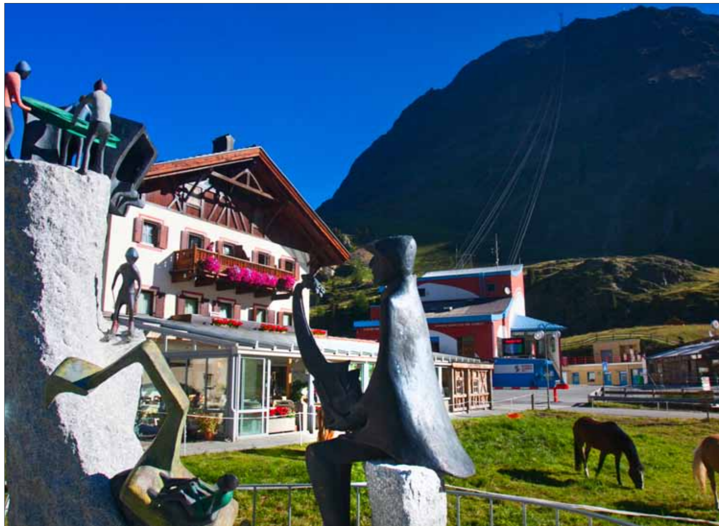
Im Vordergrund das Denkmal von Leo Gurschler mit Blick zur Gletscherbahn und Grawand