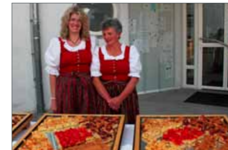
Ums leibliche Wohl bemüht