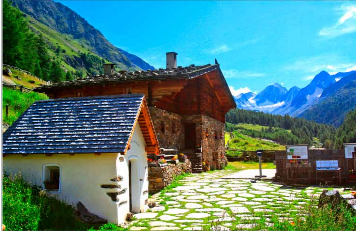
Rableid Alm