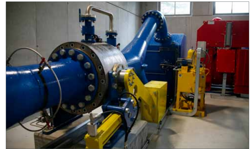
Wasserkraftwerk der Energie Schnals GmbH

Vom Werksgebäude hat man einen wunderbaren Blick auf den Stausee von Vernagt, dessen Wasserfarbe im