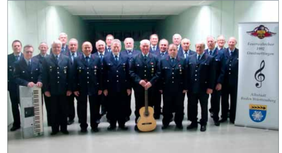
Feuerwehrchor Onstmettingen aus dem Bundesland Baden Württemberg

Voraussetzungen zu schaffen, damit unsere Bürgerinnen und Bürger möglichst lange selbständig in ihrer vertrauten Umgebung leben können. Es geht auch darum neue Angebote und Pflegeformen anzudenken, die pflegebedürftigen Menschen im Alltag eine angemessene Begleitung und Unterstützung bieten.