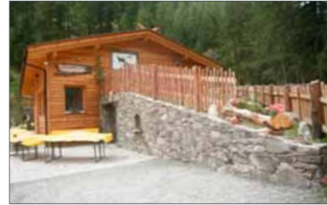
Neue Kühlzellen des Jagdrevier in Unser Frau

den kann. Der Revierleiter dankte im Namen der gesamten Jägerschaft dem Land und der Gemeinde für die Unterstützung und allen, die freiwillig und unentgeltlich am Bau mitgeholfen haben.