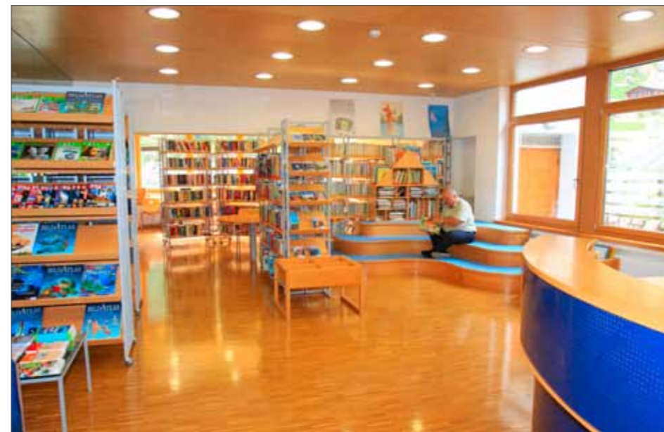
Öffentliche Bibliothek Schnals

Preisgünstige Bücher und Zeitschriften zu erwerben