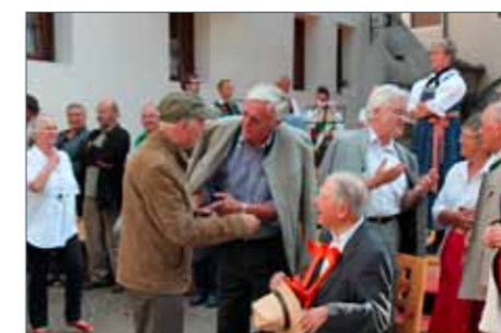
Diskussion über Kunst und Kultur

Ein Dank auch an dieser Stelle an den HGV Schnals, in besonderer Weise an das Hotel zur Goldenen Rose, das Hotel Goldenes Kreuz und das Restaurant Grüner, für den gelungenen Schnalser Umtrunk. Hier einige fotografische Eindrücke von der Vernissage am 20. Juli.