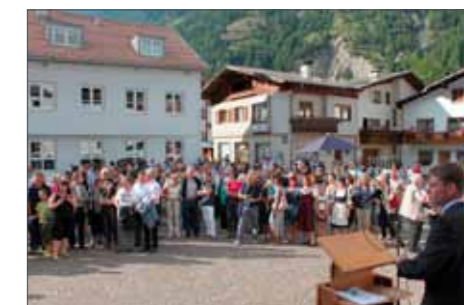
Interessierte Gäste und Besucher