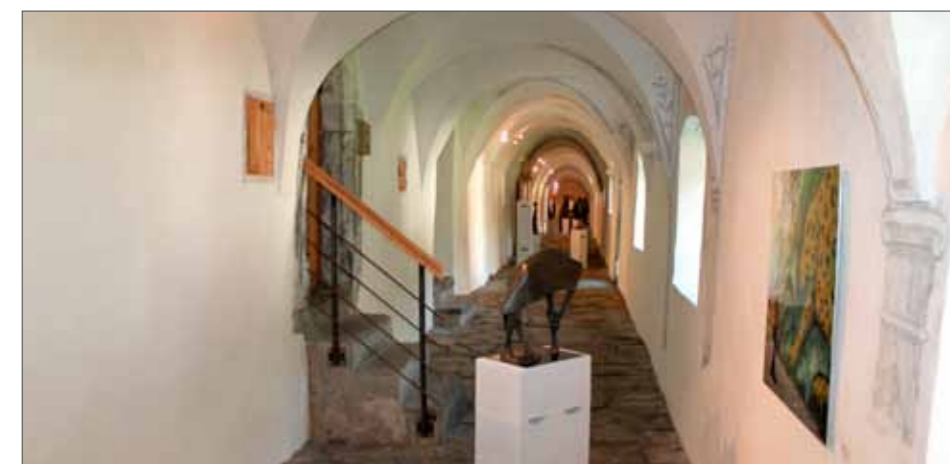
Die Ausstellung SPUREN