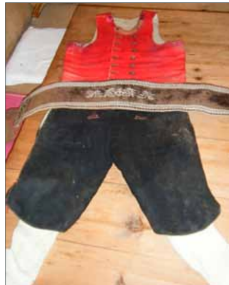
„Trachtenfragmente vom Saxalhof“