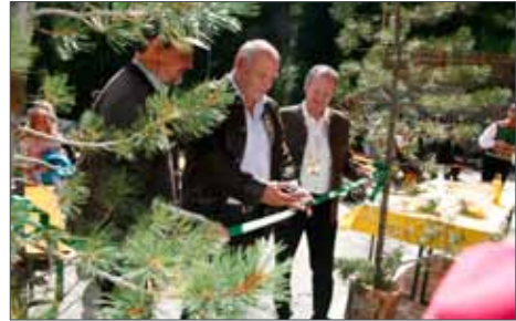
Banddurchschneidung durch LH Luis Durnwalder