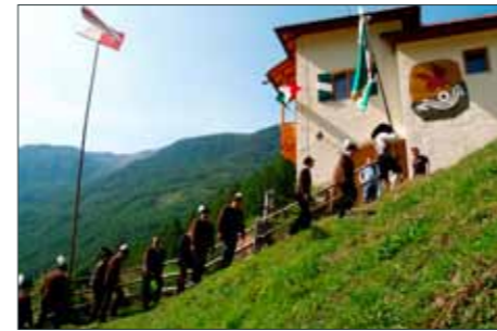
Aufstieg zum Schießstand