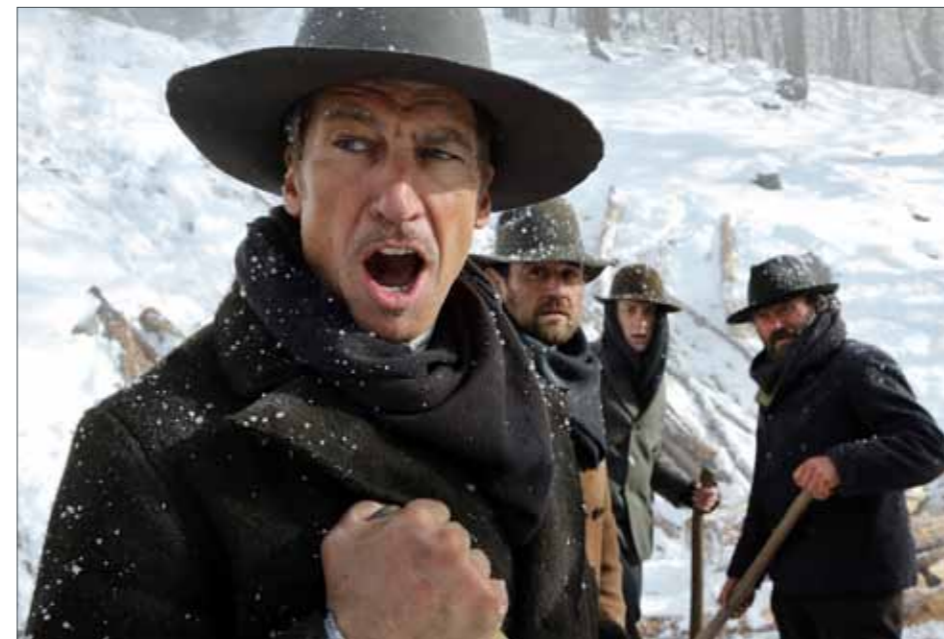
Szene aus dem Film „Das finstere Tal“

In den nächsten Monaten stehen Dreharbeiten für einen weiteren Film im Schnalstal an.