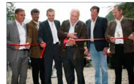
Banddurchschneidung durch LH Luis Durnwalder

Herbst eine Augenweide ist. Trotzdem, der Bürgermeister sprach auch die andere Seite der Medaille an. Der Bau in den 50er Jahren brachte große Einschnitte mit sich, im Gesellschaftsgefüge und im Wasserhaushalt der Gemeinde, er erlebe das heute noch hautnah mit.