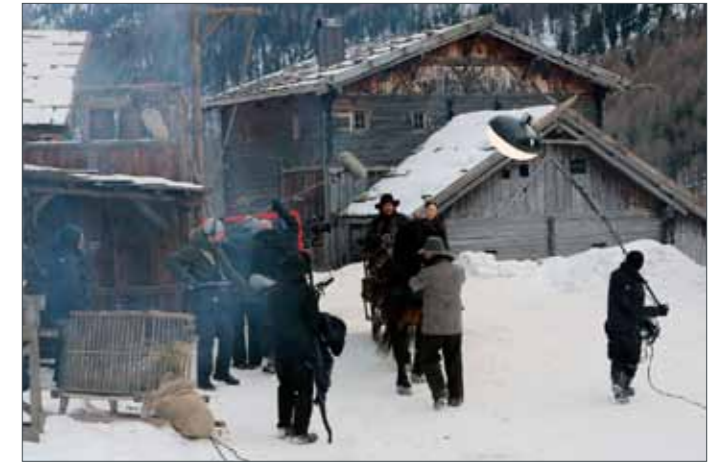
Szene aus dem Film „Das finstere Tal“

Dazu gehöre zum ersten die direkte Förderung der lokalen Wirtschaft: Wo ein Film gedreht wird, wird Geld ausgegeben, das zu einem maßgeblichen Teil am Drehort bleibt und dem Hotelier, dem technischen Personal oder dem Handwerker zugute kommt. Dieser wirtschaftliche Regionaleffekt oder „Südtirolereffekt“ ist gesetzlich genau geregelt: Mindestens 150 Prozent