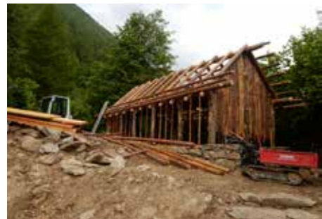
Im Archeo Parc

In diesen fünf Jahren haben wir versucht angelaufene Projekte zu beenden und angedachte Vorhaben auf die Beine zu stellen. Investiert wurde in die Trinkwasserversorgung, in den Neubau des Recyclinghofes, ins Glasfasernetz, in den Fuhrpark der Gemeinde, in den Ausbau des Archeo Parcs, in die Opti-