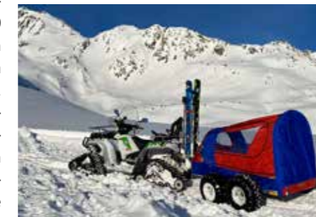
Quad mit Anhänger

Das neue Einsatzfahrzeug war bereits bei der Lawinenübung mit den Feu-