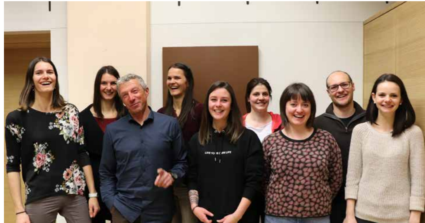
Der neue Ausschuss der Musikkapelle Schnals

Am Samstag, den 11. Jänner 2020 fand die ordentliche Vollversammlung der Musikkapelle Schnals im Probelokal in Unser Frau statt.