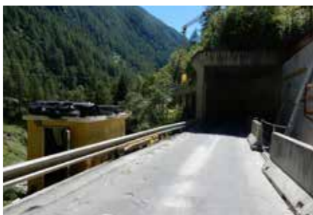
Verlängerung Galerie Pfossental

Die Straße durchs Tal soll insgesamt sicherer werden. Hier wird mit dem Amt für Tiefbau, dem Straßendienst und dem Amt für Wildbachverbauung zusammengearbeitet. Gefährliche Teilstücke, gefährdet durch Massenbewegungen, Muren und Lawinen werden