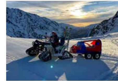
Quad am Lazaun in Einsatz

Vor kurzem konnte der Bergrettungsdienst im AVS Schnals ein neues Einsatzfahrzeug entgegennehmen. Dabei handelt es sich um ein „ATV“ (All Terrain