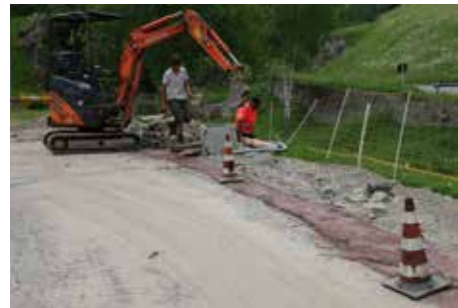
Ausbau Zufahrt Oberhöfe

Mit Mai 2020 endet die laufende Amtsperiode. Es sei hier gestattet einen kurzen Rückblick über die Tätigkeit der letzten 5 Jahre zu machen. Vieles aus der programmatischen Erklärung des Bürgermeisters für die Jahre 2015 - 2020 konnte auch umgesetzt werden. Es waren insgesamt fünf erfolgreiche Jahre. Das Anliegen des Bürgermeisters mit seinem Ausschuss und seinem Gemeinderat war es die Entwicklung des Tales mehrgleisig voranzutreiben, das heißt in wirtschaftlicher, kultureller und sozialer Hinsicht. Es wurde versucht den Menschen in den Mittelpunkt zu stellen, das Vereinsleben wurde weiterhin tatkräftig unterstützt. Für die Bürgerinnen und Bürger ist es auch wichtig, dass die angebotenen Dienstleistungen gut funktionieren, die Grunddienste gesichert sind und der Einsatz der öffentlichen Gelder verantwortungsbewusst erfolgt.