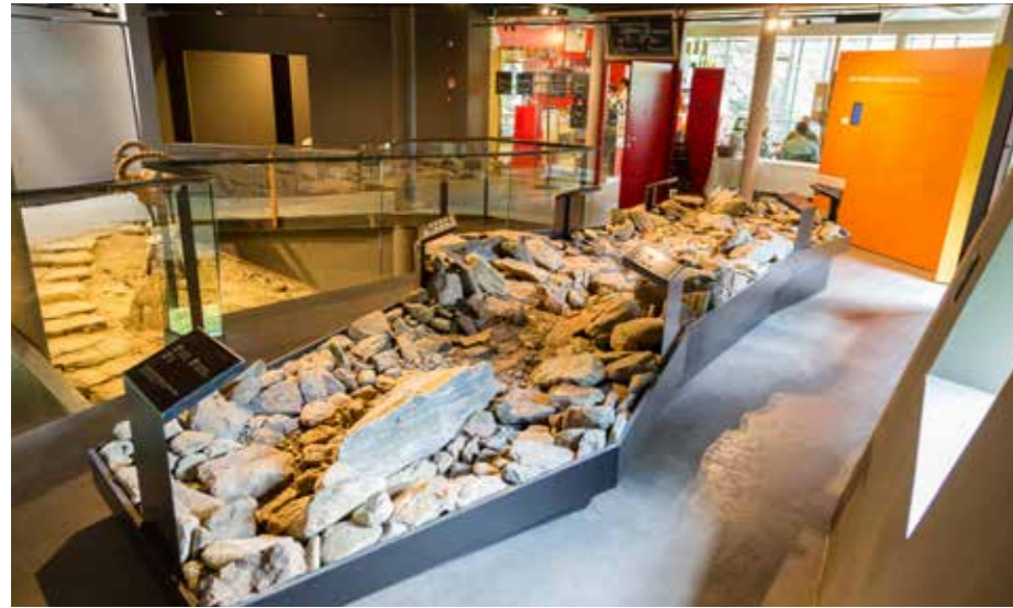
Auf der dritten Ebene im archeoParc: Das Modell der Ötzi-Fundstelle (Vordergrund) und die Cafeteria (Hintergrund).

Bei der Mitgliederversammlung Mitte Februar stellte der Vorstand wie gewohnt Tätigkeitsbericht und Bilanz vor.