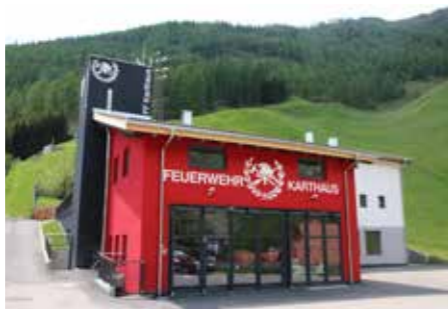
Sanierung Vereinshaus Karthaus mit Feuerwehrhalle

mierung touristischer Strukturen wie Wanderwegenetz mit Startplätzen, in die energetische Sanierung gemeindeeigener Gebäude, in den Umbau und Ausbau derselben, in die Ausstattung