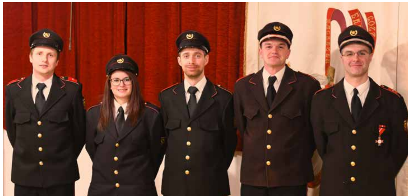
Der neue Ausschuss der FF Katharinaberg