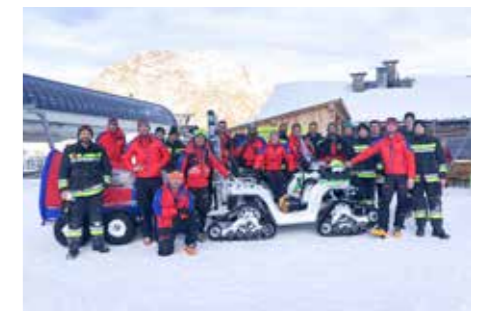
Gruppenfoto FF und BRD auf Lazaun

erwehren des Tales eine große Bereicherung. Mit dem Fahrzeug wurden die Retter von der Bergstation Lazaun zur Lawine gefahren und die Patienten abtransportiert. Die Übung wurde von den Schnalstaler Gletscherbahnen und vom Skiservice Stricker unterstützt. Nach der Übung lud die Schnalstaler Gletscherbahn alle Beteiligten zu einem Essen auf der Lazaunhütte ein. Bis der Umbau beim Zivilschutzzentrum abgeschlossen ist, wird das „ATV“ und die Anhänger in der Feuerwehrrhalle Unser Frau geparkt. Ein Dank an dieser Stelle an die Feuerwehr für die Übergangslösung.