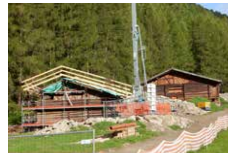
Im Freilichtmuseum Unser Frau - Wiederaufbau Gorfermühle

Zur Energie ist folgendes zu sagen. Wir als Gemeinde sind nun zu 98% Besitzer des E-Werkes am Ende des Stausees Vernagt. Der 40%ige Gesellschaftanteil der ehemaligen SEL AG, heute Alperia Greenpower GmbH, wurden zurückgekauft. Unser E-Werk führt die Energie Schnals Konsortial GmbH. Der zweite Gesellschafter ist (bei einer Konsortial GmbH gesetzlich vorgesehen) der SEV