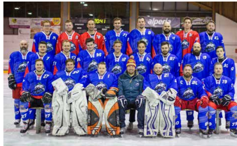
Mannschaft „ICEBEARS“ Schnals - 2019/2020