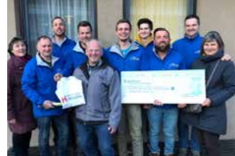
Überreichung des Schecks an die Krebshilfe

Nach einem intensiven Jahr 2018 mit dem Sieg im Wettbewerb um die Imagekampagne Generation H auf Landesebene und der damit verbundenen Spendensumme von über 5.300 Euro für wohltätige Zwecke ließ es das Handwerk Schnals 2019 etwas ruhiger ange-