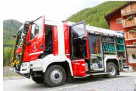
Neuer Tanklöschwagen der FF Unser Frau

Das Erntedankfest am 6. Oktober war ein besonderes der Freiwilligen Feuerwehr Unser Frau. Dieser Tag stand in diesem Jahr für die Feuerwehr ganz im Zeichen der Segnung des neuen Tanklöschwagens.